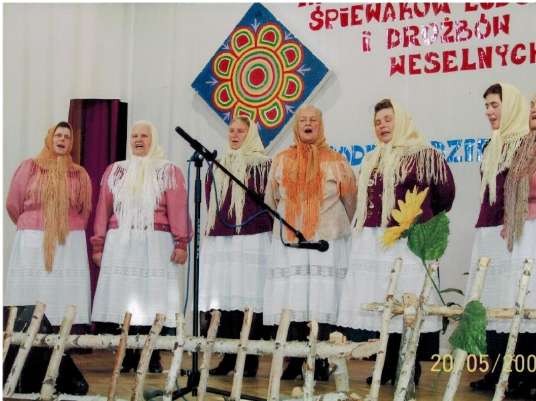
Druzbacka Podegrodzie 2006 rok.