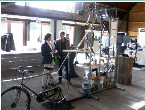
Centrum OZE, Holandia