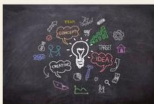
World Entrepreneur's Day