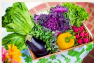
World Food Safety Day (Test Challenge)