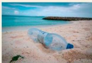
World Nature Conservation Day