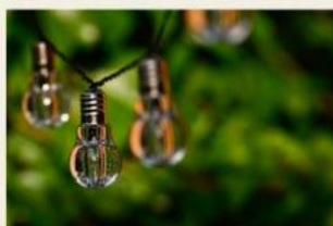
European Sustainable Energy Week