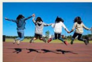
International Youth Day