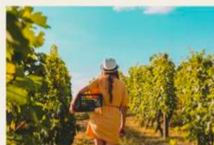
International Day of Rural Women