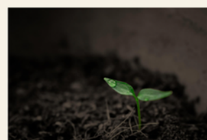
World Soil Day