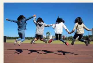
International Youth Day