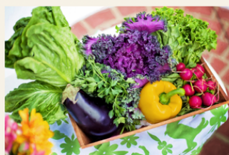
World Food Safety Day (Test Challenge)