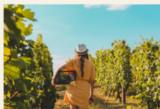
International Day of Rural Women