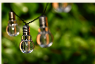
European Sustainable Energy Week