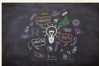
World Entrepreneur's Day