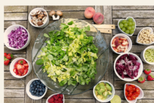
World Food Day