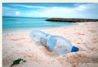
World Nature Conservation Day