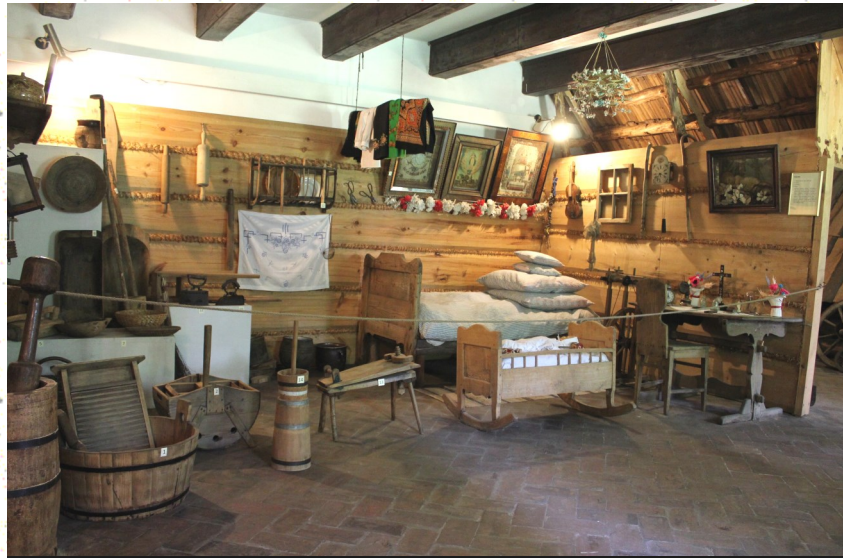
Izba regionalna w Suchej Beskidzkiej

„Ludzie nie chcą być dzisiaj zarządzani. Ludzie pragną, aby im przewodzić. (...) Przywódca intelektualny, tak. Przywódca polityczny, tak. Przywódca harcerski. Przywódca lokalny. Przywódca związkowy. Przywódca w biznesie. Oni przewodzą. Oni nie zarządzają. Zapytaj konia...”