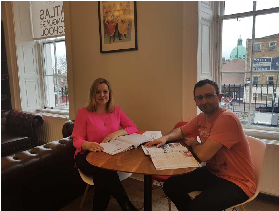
Biblioteka w szkole językowej Atlas

Jeszcze przed przyjazdem do szkoły językowej dostaliśmy link z testem pisemnym badającym nasz poziom znajomości języka angielskiego. Egzamin obejmował 50 pytań, głównie z zakresu gramatyki i słowotwórstwa. Po przyjeździe do szkoły dodatkowo odbył się egzamin ustny. Podzielono nas na 2- osobowe zespoły (starając się łączyć osoby z różnych krajów), a następnie mieliśmy rozmowę z nauczycielami. Rozmowa dotyczyła naszych zainteresowań, pracy zawodowej oraz oczekiwań wobec kursu. Po przydzieleniu do dwóch różnych grup, każdy z nas otrzymał książkę, materiały dydaktyczne oraz mapę Dublinia z praktycznymi wskazówkami.